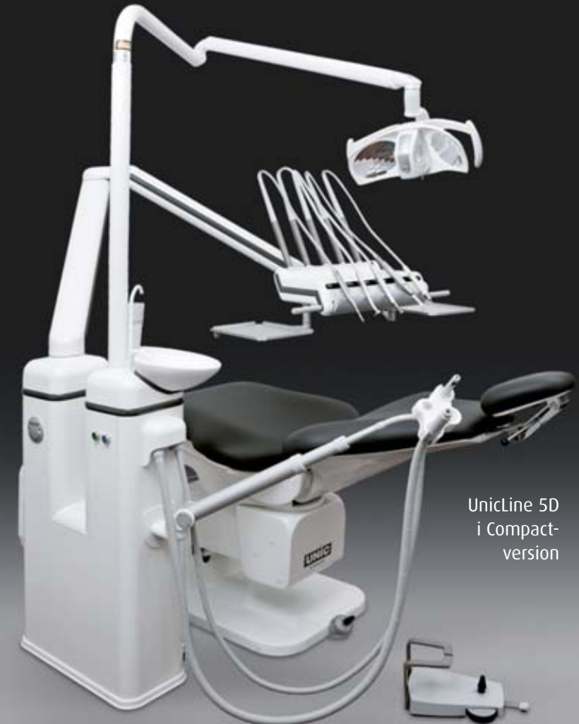
UnicLine 5D i Compact- version

'UnicLine leveres med balance- eller underhængte instrumenter og desuden i søjle- og cart-modeller'